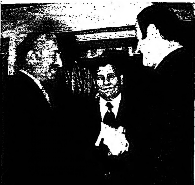
مصلحة بين الرئيس الاستاذ الرئيس كرامي، وفي الوسط رئيس الوزراء السوري السيد محمود الايوبي

القاهرة تعيد - تنمة انتهت أمس دورة برمانا المحلية بكرة العشب طويبت صحتها وبتقارر إعادة رفع الستار من دورة جديدة في العام القادم. خسر عيسى فوز أمس بطولة نروي الرجال عندما خرج لجور أبو حنون في المباراة النهائية بثلاث مجموعات لسر. قد كانت النتائج الفنية لبقعة نروي الرجال على التوالي ١ - ٦ - ٦ - ١ و ١ - ٦ - ١ - ٦